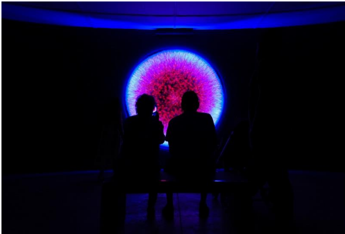
Photosphere | Leandro Mendes

A ideia é proporcionar aos visitantes uma jornada sensorial que contempla a riqueza de significados oferecidos pelo Sol, da essência física ao impacto na vida terrestre.