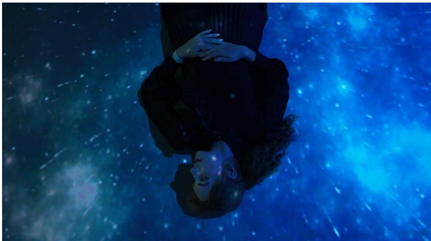
Gênesis | Estúdio AYA

Qualquer pessoa, de qualquer idade, poderá vivenciá-las. Isso porque o visitante sai da contemplação e passa para a imersão, se torna parte da experiência.”