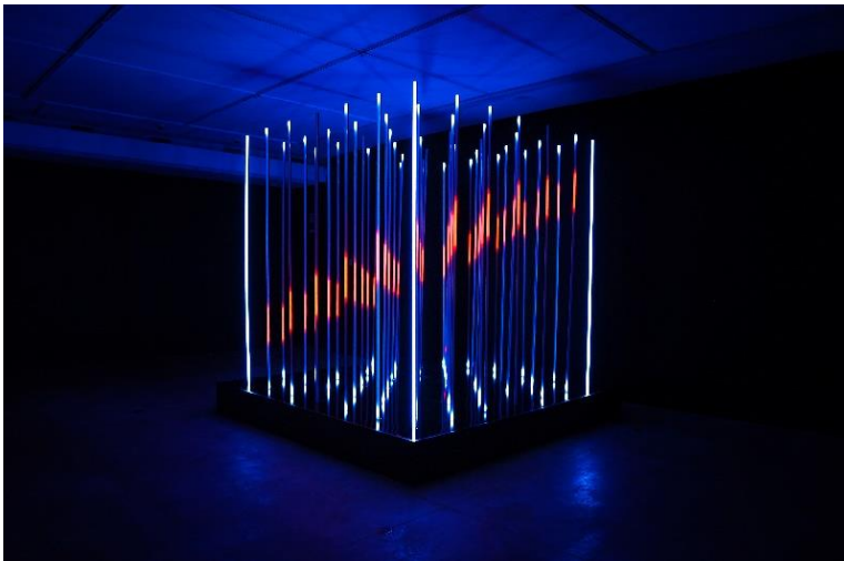
Continuum | Estúdio Sala 28

Além de celebrar a principal estrela do sistema solar, a exposição provoca reflexões sobre o impacto do Sol na natureza, na sociedade e na sustentabilidade. Embora traga uma mensagem reflexiva, relacionada ao meio ambiente, o tema é abordado de uma forma lúdica e poética. “Somos bombardeados o tempo todo por notícias negativas. A exposição não tem esse intuito. É um lembrete sobre a importância essencial do Sol para a vida na Terra e como as pessoas podem ver sua beleza em pequenos momentos”, ressalta Antonio Curti.