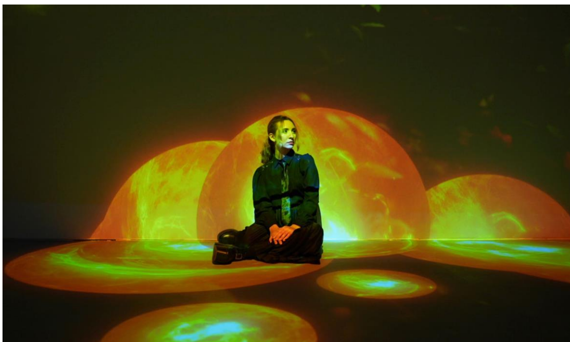
Gênesis | Estúdio AYA.

Imagens, press releases e materiais para uso da imprensa: https://agenciaqalo.com/luz/