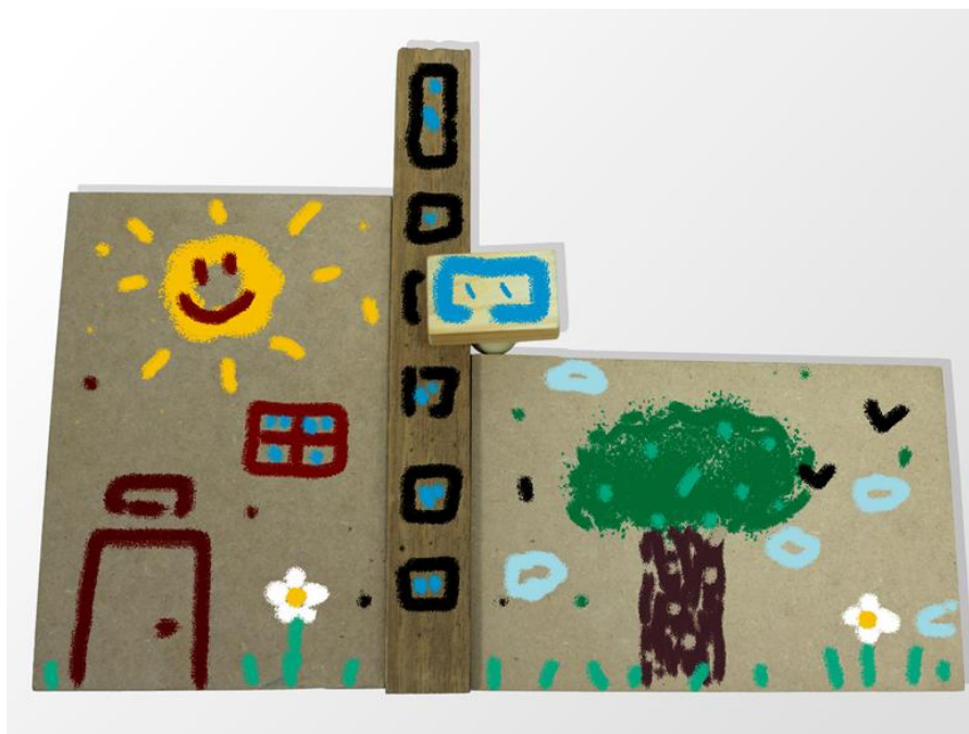
Primeiro Brincar: "ConstruSom"